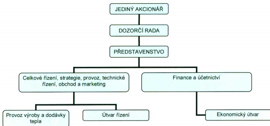
Schéma č. 1 – Organizační schéma společnosti k 30. září 2013